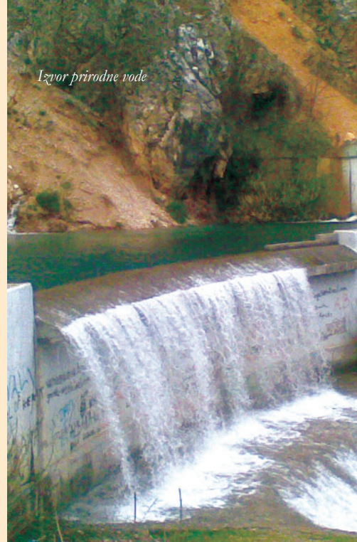
Izvor prirodne vode

Ova brošura je pripremljena za aktere u opštini Istok da bi se upotpunio Plan regionalne baštine i njegove preporuke. Ona podstiče aktivno angažovanje lokalnih zajednica i aktera u primerni prioriternih mera u opštini, u koordinaciji sa pet drugih opština u regionu, kao i sa centralnim organima vlasti.