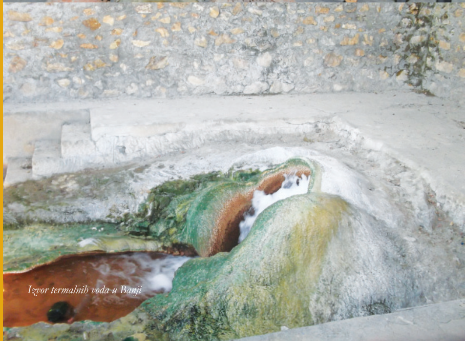
Izvor termalnih voda u Banji