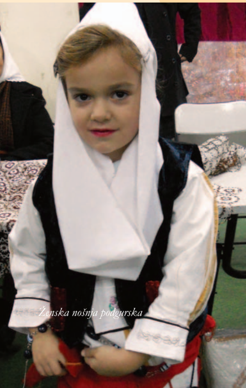
Ženska nošnja podgurska

Bogati vodeni pejzaž u sredini kroz vreme je predstavljao mnoge mogućnosti i obogatio je jedinstvenim karakterom. To se ogleda u mnogim mostovima i mlinovima koji i dalje postoje kao kulturni spomenici, uključujući Kameni Most u Žaču (17. vek) i mlin Čelja Bicaja u selu Vrelo (19 – 20. vek). Sredina ima i kule, kao karakteristične stambene kule od kamena, kao što je kula Čerim Rugova u selu Lukavac, koja je izgrađena 1900. god. Tradicionalni seoski život zajednica u Istoku predstavlja se organizovanjem zajedničkih događaja poput Lamine večere koja obeležava uspešnu sezonu i žetvu za stoku i poljoprivredu u celom regionu.