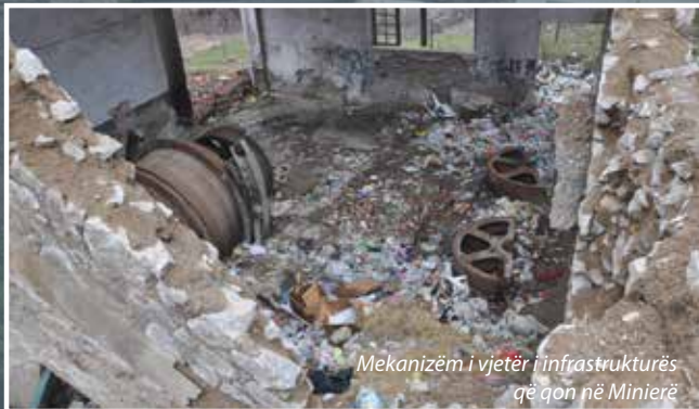
Mekanizëm i vjetër i infrastrukturës që qon në Minierë