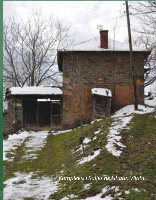
Kompleksi i Kullës në fshatin Vllahi