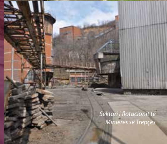
Sektori i flotacionit të Minierës së Trepçës