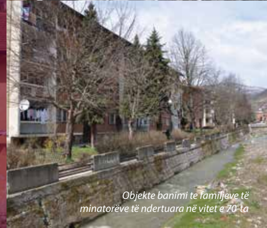
Objekte banimi të Familjeve të minatorëve të ndërtuara në vitet e 70-ta