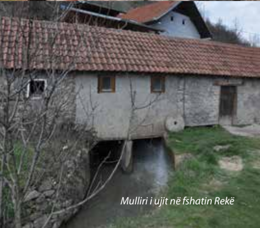
Mulliri i ujit në fshatin Rekë