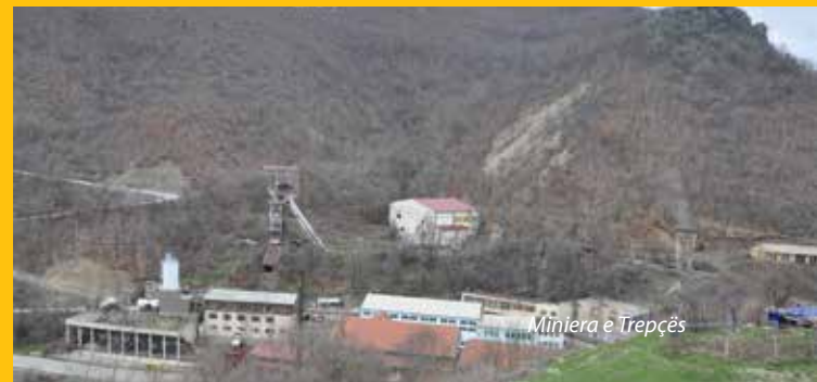
Miniera e Trepçës

Pas Luftës së Dytë Botërore rëndësia e Trepçës në zhvillimin industrial të Federatës Jugosllave mund të vërehet nga investimet e mëdha të bëra brenda një periudhe prej afro tridhjetë vjetëve. Në mes të viteve 1960 dhe 1980 u ndërtua një fabrikë e plehrave e mbështetur nga një impiant i acidit sulfurik, një flotacion i ri në Tunelin e Parë si dhe një rafineri e plumbit.