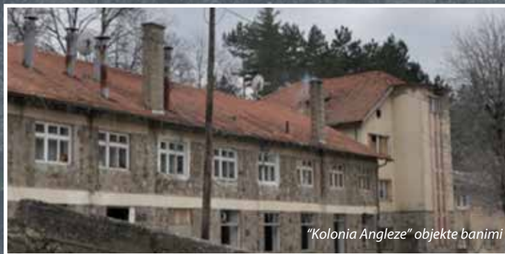
"Kolonja Angleze" objekte banimi