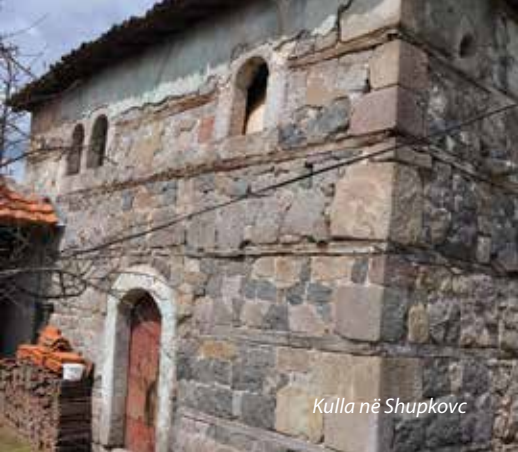
Kulla në Shupkovci