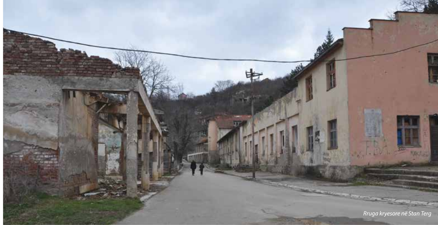
Rruga kryesore në Stan Terg