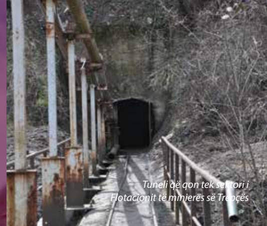
Tuneli që çon tek sektori i Flotacionit të minierës së Trepçës