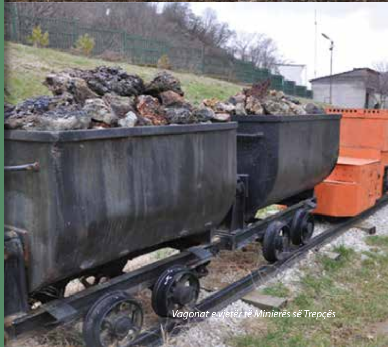
Vagonat e vjetër të Minierës së Trepçës