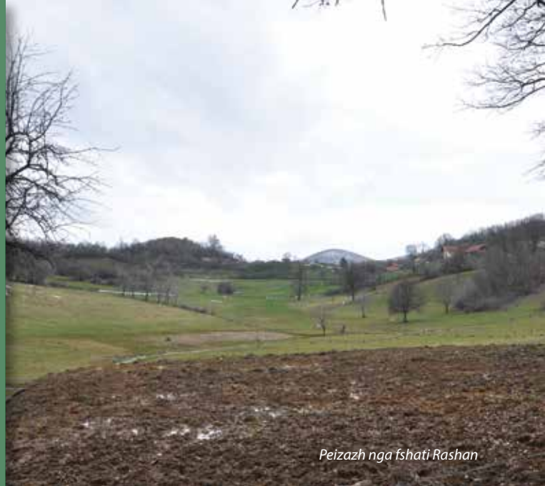
Peizazh nga fshati Rashan