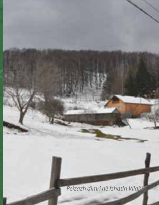
Peizazh dimri në fshatin Vllahi