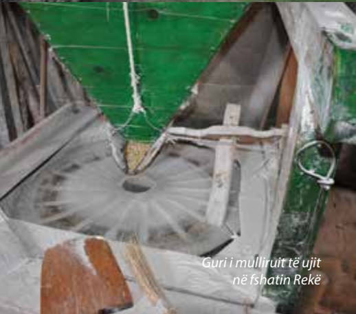
Guri i mullirit të ujit në fshatin Rekë