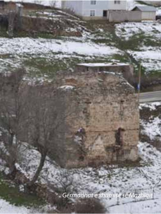
Gërmadhat e xhamisë së Mazhiqit