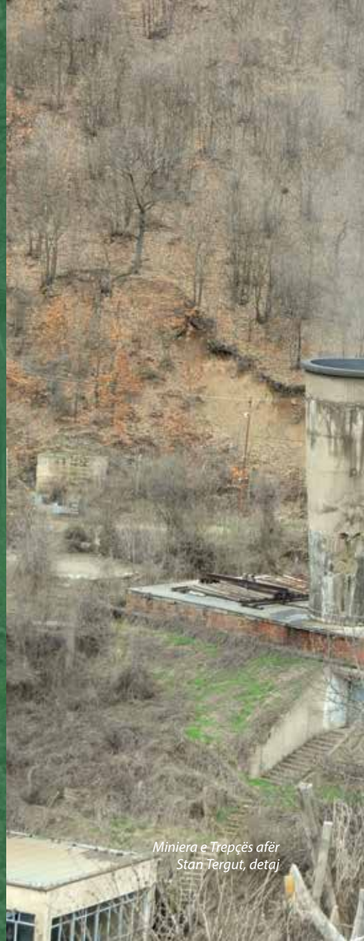
Miniera e Trepçës afër Stan Tërgut, detaj