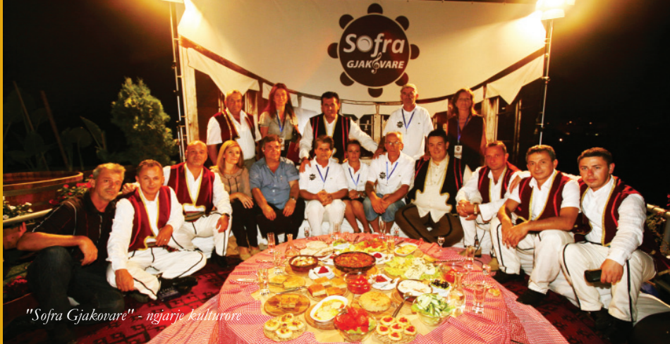
"Sofra Gjakovare" - ngjarje kulturore

• Janë realizuar pilot veprimet në gjashtë komuna të Kosovës Perëndimore njëkohësisht. Këto pilot veprime përbëheshin nga tre komponentë që luajtën rol të rëndësishëm për angazhimin e komunitetit gjatë përgatitjes së Planit Rajonal për Trashëgimi.