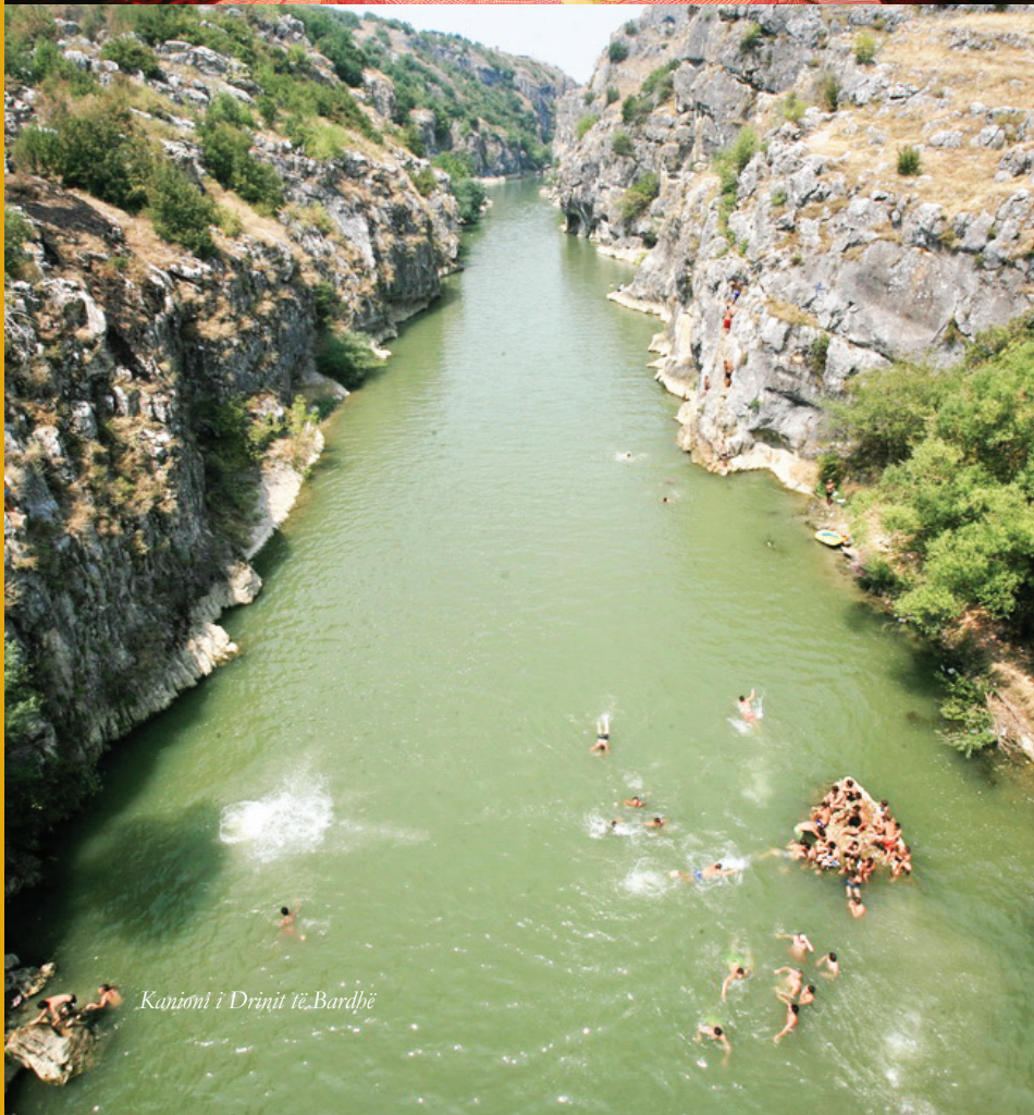
Kanioni i Drinit të Bardhë