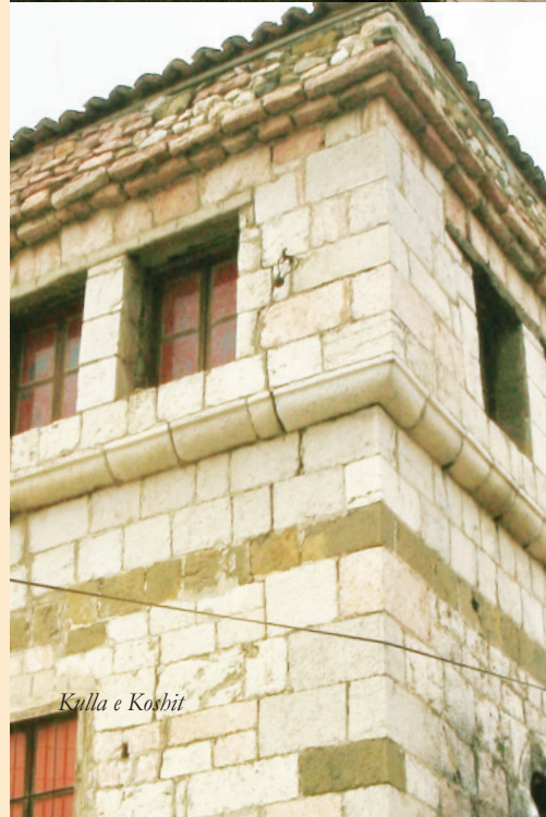
Kulla e Koshit