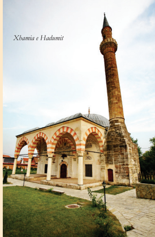
Xhamia e Hadumit

Kjo fletushkë është përgatitur për akterët në komunën e Gjakovës për të shoqëruar planin rajonal të trashëgimisë dhe rekomandimet e tij, duke inkurajuar përfshirje aktive të komuniteteve dhe akterëve lokalë për zbatimin e veprimeve prioritare në komunë, në koordinim me pesë komunat tjera në rajon, si dhe me autoritetet qendrore.