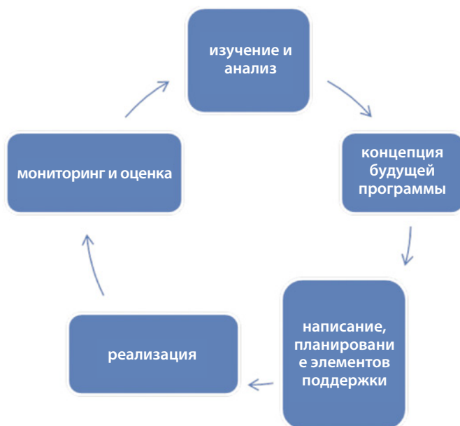
Рис. 1. Этапы разработки и пересмотра учебных программ

В последние годы международные организации, отвечая на растущий интерес к данной теме и поддержку со стороны государств-членов, содействовали разработке соответствующих рамочных документов. Руководство для педагогов «Воспитание глобальной гражданственности: темы и цели обучения», выпущенное ЮНЕСКО в 2015 г., предлагает базу для определения целей образования в духе глобальной гражданственности, задач обучения и компетенций, а также приоритетов для оценки и анализа обучения. В мае 2015 г. министры иностранных дел европейских стран призвали к принятию основных компонентов подготовленной Советом Европы новой рамочной системы компетенций для осуществления демократической гражданственности 8 . БДИПЧ ОБСЕ в 2012 г. разработало компетенции учащегося как часть более общего руководства в помощь планированию, реализации и оценке образования в области прав человека в средней школе 9 .