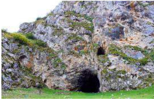
La cave de Tren

Paysage et coopération transfrontalière Le paysage ne connaît pas de frontière