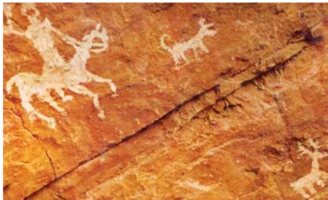
Peinture rocheuse de Spile