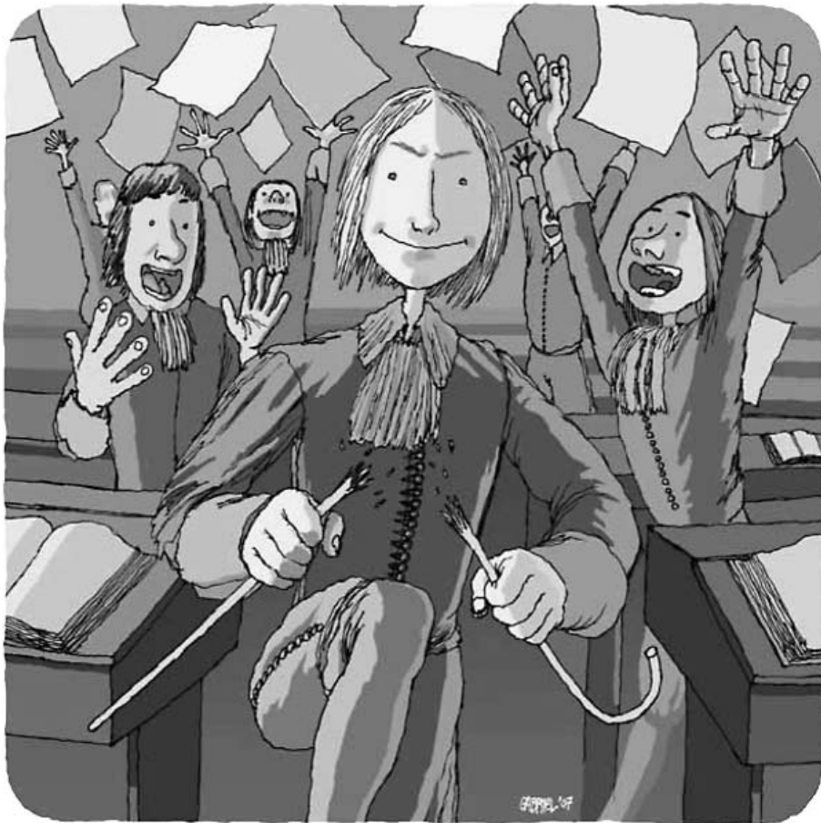
1669: палаво момче се противи на казнувањето во училиштето и пишува петиција до Парламентот на Обединетото Кралство.