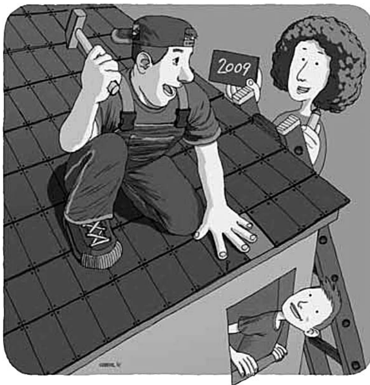
Целната дата за универзална забрана.

Советот на Европа играше клучна улога во процесот на изработка на Студијата на ОН и е посветен на обезбедување на повратни информации од нејзините препораки во Европа. Иницијативата на Советот на Европа против физичкото казнување има за цел да постигне забрана на секаков вид физичко казнување и да промовира позитивно воспитување и култура на ненасилство со цел да обезбеди детство во кое нема да има насилство за ниту едно дете.