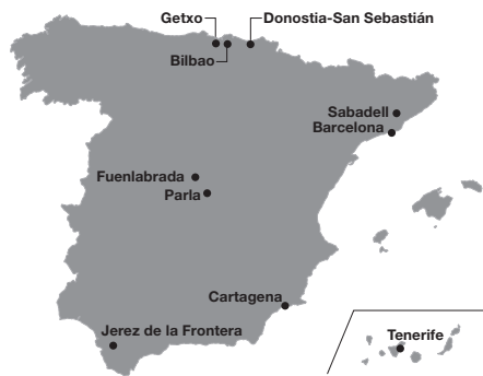
FIGURA 1. Las ciudades RECI

Durante los dos años de vida, la Red se ha consolidado y ha construido un marco de diálogo y cooperación especialmente intenso entre las ciudades participantes. A pesar de las diferencias existentes entre las mismas, la RECI se ha convertido en un espacio de encuentro en el que compartir problemas específicos y dudas conceptuales, y en el que encontrar fórmulas distintas para enfocar cuestiones concretas. La Red se ha hecho fuerte en aquellos puntos comunes que permiten a las ciudades construir un espacio de confianza en el que hablar, discutir y aprender mutuamente, sin por ello dejar de lado las especificidades locales que enriquecen todo este proceso.