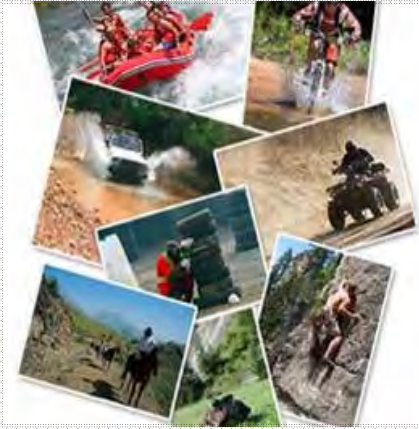
TURİSTİK AÇIK ALAN AKTİVİTELERİ İÇİN GEREKLİ EKİPMAN