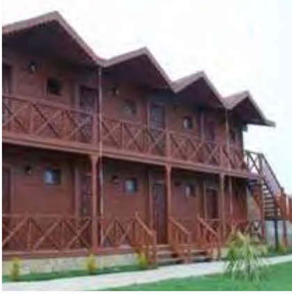
TURİSTİK AÇIK ALAN AKTİVİTELERİ İÇİN GEREKLİ EKİPMAN