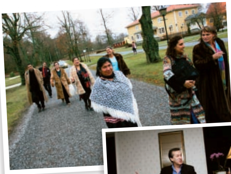
Pe o drom kaj o kjidipe.

“Me patjav ke le Konferenciako anav “Amare Glasura Ashunde” erdemlisardas pesko anav – de rudjij vi te anklistel “Amare Glasura Serande”.