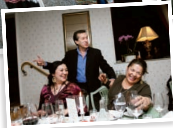
O djilabitori Hans Caldaras djilabadas pasha riatjako xabe.