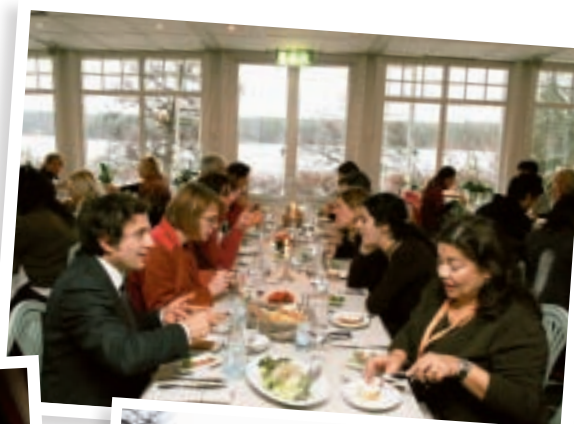
O Luncho pe veranda.