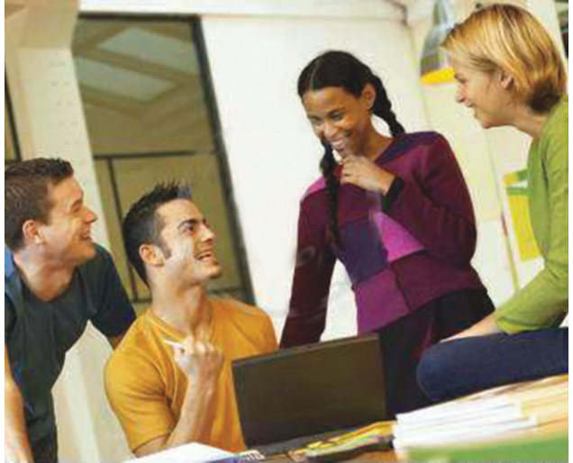
Залучення молоді – один із пріоритетних напрямків діяльності Конгресу

Конгрес також заснував Статутний форум , який складається з голів національних делегацій та 17 членів Бюро, що діють від імені Конгресу у міжсесійний період.