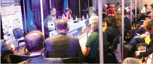
Конгрес організував участь представників Албанії у Міжнародному муніципальному ярмарку в Хорватії в рамках NEXPO-2013.

З метою зміцнення місцевої демократії Конгрес активно розвиває співробітництво та партнерство з країнами-членами та іншими інституційними органами та Європейськими асоціаціями. Конгрес пропонує низку заходів на місцях, спрямованих на виконання положень Європейської хартії місцевого самоврядування та рекомендацій Конгресу.