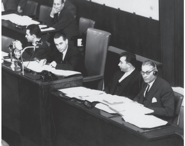
Жак Шабан-Дельма (Франція), перший президент Конференції місцевих влад, 12 січня 1957 р.

Витяг із промови Жака Шабан-Дельма від 12 січня 1957 року