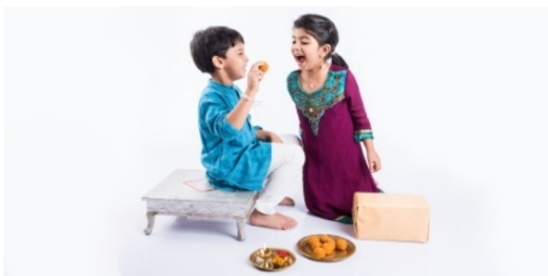
αδελφός / αδελφή