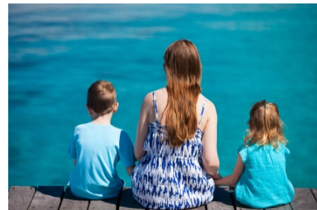
γιος / κόρη