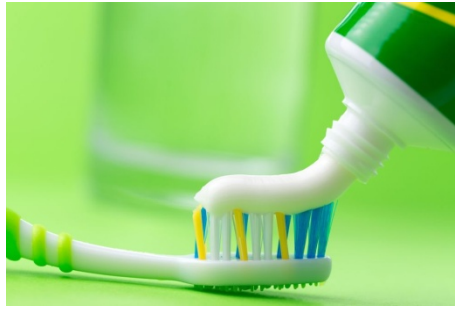
οδοντόβουρτσα / οδοντόκρεμα