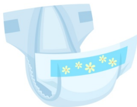
υφασμάτινη πάνα/πάνα μιας χρήσης