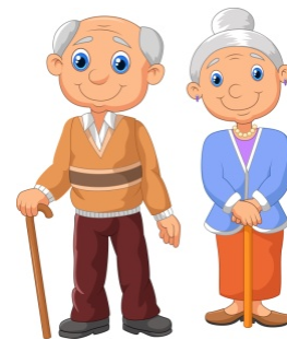
παππούς / γιαγιά