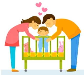
πατέρας / μητέρα